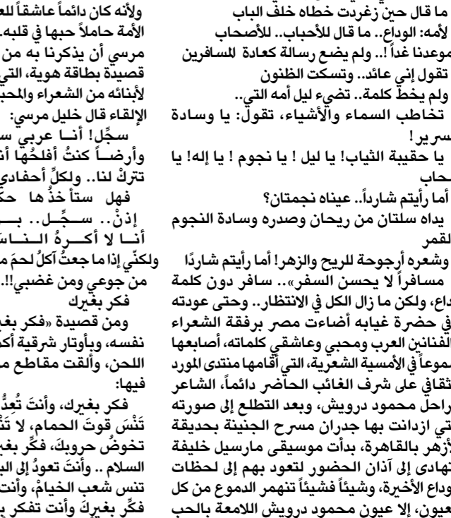
المسيرة الشعرية التي أقامها منتدى المورد الثقافي

من التواصل الإنساني، لكنه ترك وراءه أعمالاً ستظل تتحدث عنه.. فهو حتماً لن يموت، وسيظل باقياً بيننا طول العمر.