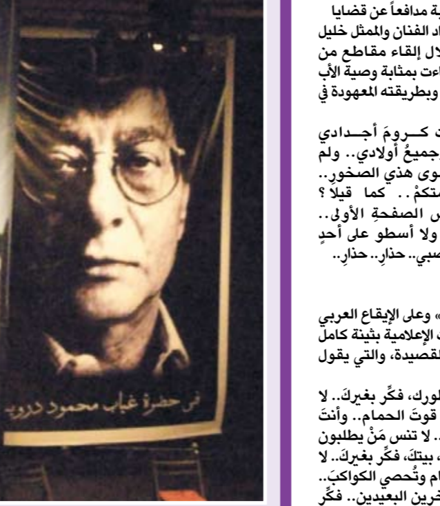
المسيرة الشعرية التي أقامها منتدى المورد الثقافي

من التواصل الإنساني، لكنه ترك وراءه أعمالاً ستظل تتحدث عنه.. فهو حتماً لن يموت، وسيظل باقياً بيننا طول العمر.