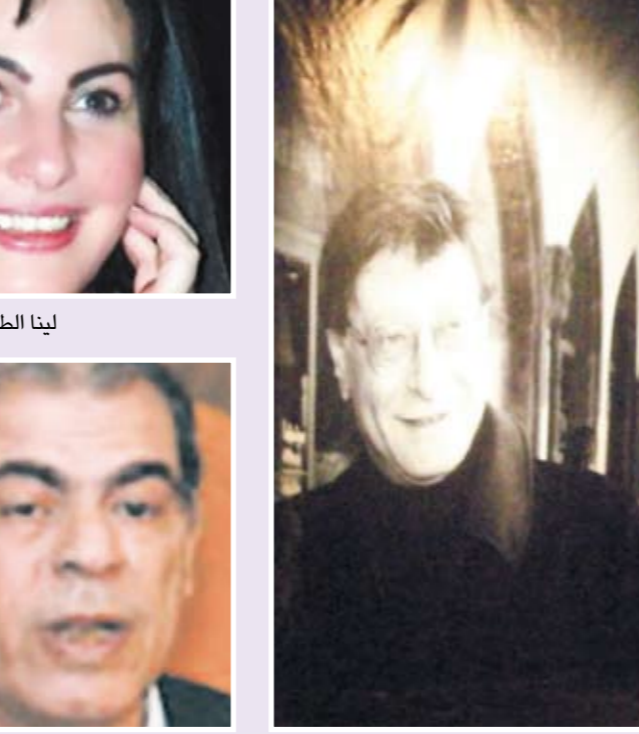
المسيرة الشعرية التي أقامها منتدى المورد الثقافي

من التواصل الإنساني، لكنه ترك وراءه أعمالاً ستظل تتحدث عنه.. فهو حتماً لن يموت، وسيظل باقياً بيننا طول العمر.